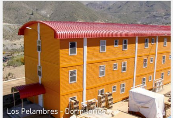
Los Pelambres - Dormitorios