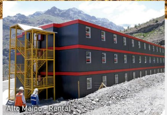
Alto Maipo - Rental

Hoy, contamos con más de 2.500.000 m 2 en proyectos desarrollados para las más importantes empresas del rubro.