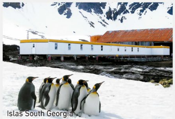
Islas South Georgia